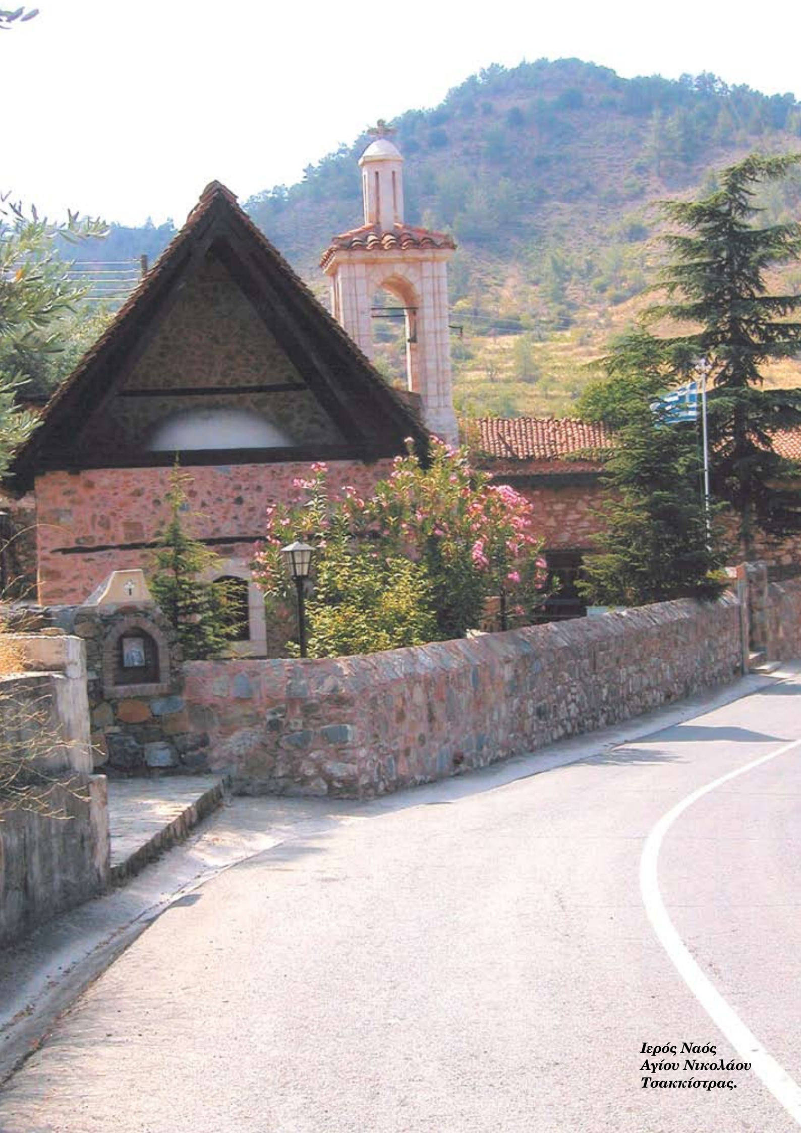
Ιερός Ναός Αγίου Νικολάου Τσακκίστρας.